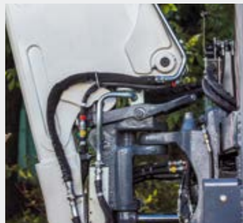
Двойной транспортный фиксатор стрелы - это уникальное устройство для транспортной блокировки, предохраняющее экскаваторную стрелу от опускания и поворота. Не требует выхода оператора, поскольку полностью управляется из кабины