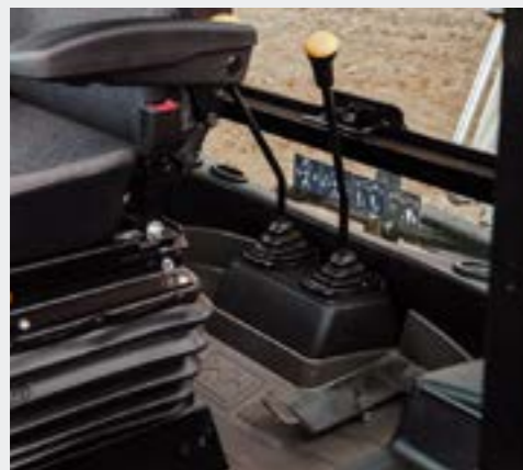
Эргономичная педаль для управления гидромолотом и выдвиганием телескопической рукояти. Способствует значительному снижению утомляемости оператора при работе

Синхронизированная 4-ступенчатая коробка передач SynchroShuttle с сервоуправлением позволяет переключать передачи во время движения, менять направление передвижения машины.