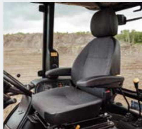
Комфортабельное сиденье оператора оснащено высокой спинкой с подголовником, подлокотниками и инерционным ремнем безопасности. Обладает всеми необходимыми регулировками