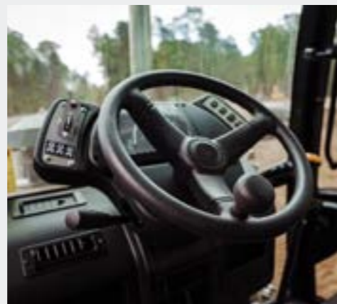
Рулевая колонка регулируется по углу наклона. Удобное рулевое колесо не требует приложения значительных усилий при маневрировании. Имеет рукоятку для облегчения управления одной рукой