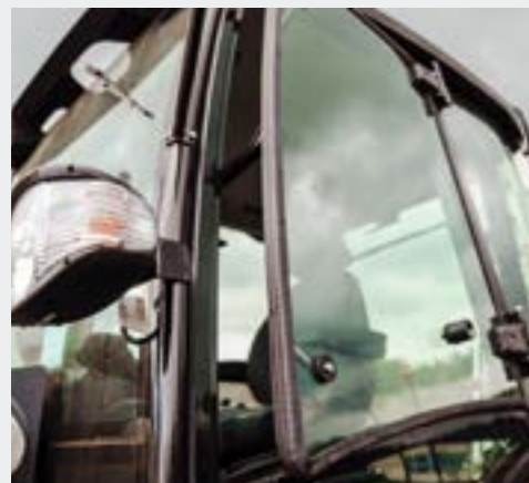
Верхние части дверей могут быть полностью открыты и зафиксированы в этом положении для лучшей вентиляции