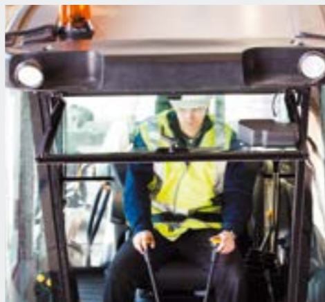
Цельное заднее окно легко открывается и фиксируется в открытом положении, создает удобный козырек от дождя, обеспечивает комфортную работу в теплый период